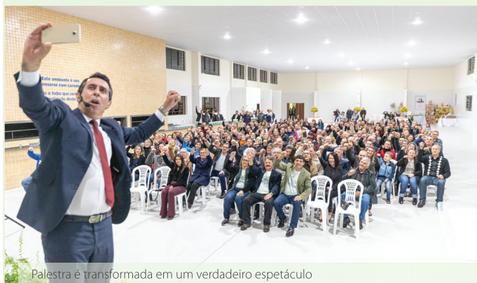
Palestra é transformada em um verdadeiro espetáculo