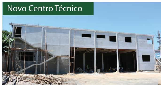
Novo Centro Técnico

Para melhorar o atendimento, a Coopercojal iniciou a construção do novo centro técnico, localizado no bairro Boa Vista, em frente à Subestação. Com 480 metros quadrados de área construída, a edificação concentrará todos os serviços técnicos e operacionais, e nela funcionarão: COD (Centro de Operação de Distribuição), Departamento Técnico, Engenharia, Faturamento, auditório e garagem de caminhões. O CT está com cerca de 80% da obra executada, com conclusão prevista para maio de 2020.