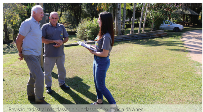
Revisão cadastral nas classes e subclasses é exigência da Aneel

O recadastramento segue a Resolução Normativa nº 800, de 19 de dezembro de 2017, que estabelece a obrigatoriedade de realização da revisão cadastral das unidades consumidoras que recebem descontos tarifários conforme a classificação acima citada.