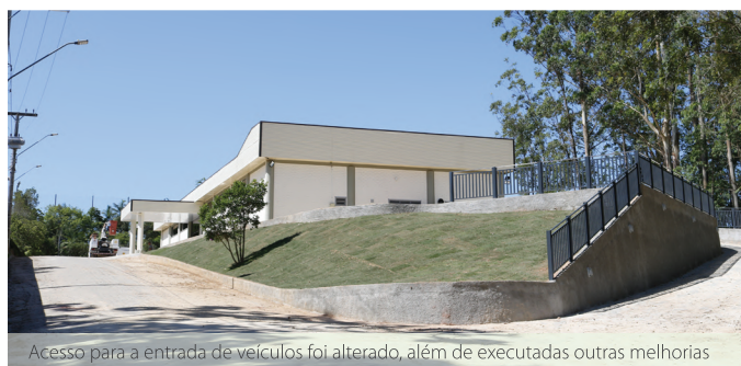
Acesso para a entrada de veículos foi alterado, além de executadas outras melhorias