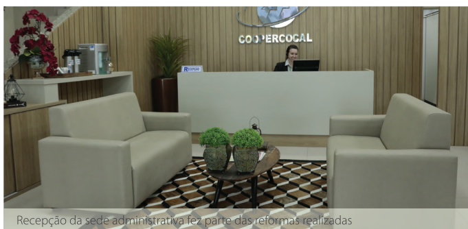
Recepção da sede administrativa fez parte das reformas realizadas