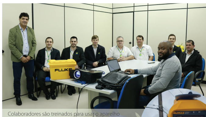
Colaboradores são treinados para usar o aparelho