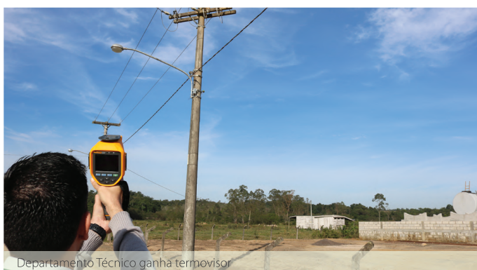
Departamento Técnico ganha termovisor

Com o objetivo de melhorar o fluxo de veículos nos dias de eventos, a entrada da sede recreativa e esportiva passou por uma grande mudança. Foi construído um novo acesso aos fundos da sede recreativa, uma estrada de mão única que sobe à direita e desce à esquerda. O estacionamento também foi ampliado e pavimentado, bem como disponibilizadas vagas para idosos e pessoas com necessidades especiais.