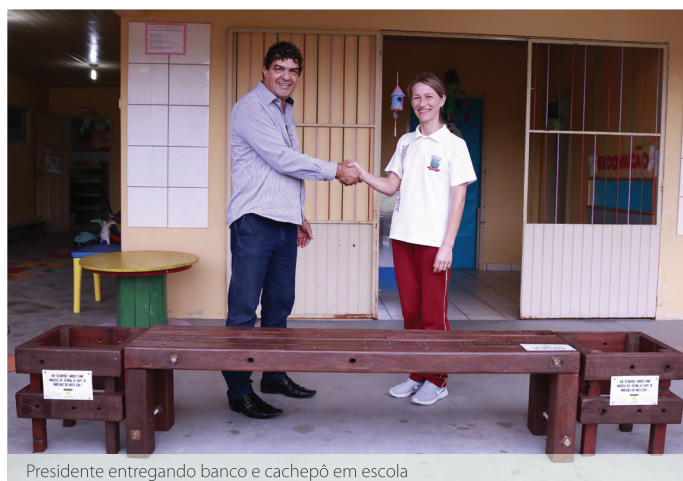
Presidente entregando banco e cachepô em escola

Foram visitadas 18 escolas, entre estaduais, municipais, particulares e creches, cujos alunos ganharam ainda um copo personalizado do mascote Benjamin e um lápis. As unidades consumidoras da Coopercocal também estão recebendo a revista.